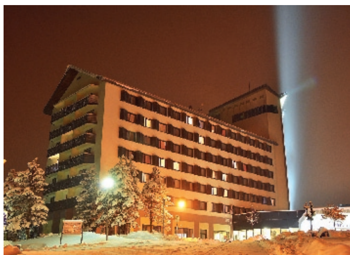
Der Rinberg ruft... und wartet auf die NAVC Motorsportler

Die NAVC Sportabteilung hat es auch für die Saison 2011 fertiggebracht, den DAM Sponsorenpool zu füllen und, ähnlich wie im vergangenen Jahr, das sagenhafte „Ringbergwochenende“ für alle Meister, etliche Plazierte und den besten Nachwuchs als Sachpreis auszuloben. Zwei Übernachtungen zur Meisterehrung auf dem Ringberg bei Suhl in Thüringen, vom Freitag bis zum Sonntag, mit Halbpension, einschl. Galadiner und den dazugehörigen Getränken, warten auf unsere Preisträger. Die Einzelheiten dazu sind in den Ausschreibungsflyern einer jeden Meisterschaft zu finden; auch auf unserer Web-Site unter dem Menüpunkt „DAM Meisterschaften 2011“.