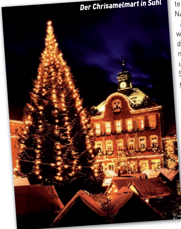
Der Chrisamelmart in Suhl

Unsere Wohnmobilisten können die beschriebenen Leistungen auch ohne Zimmer buchen, Strom wird gegen eine kleine Gebühr zur Verfügung gestellt.