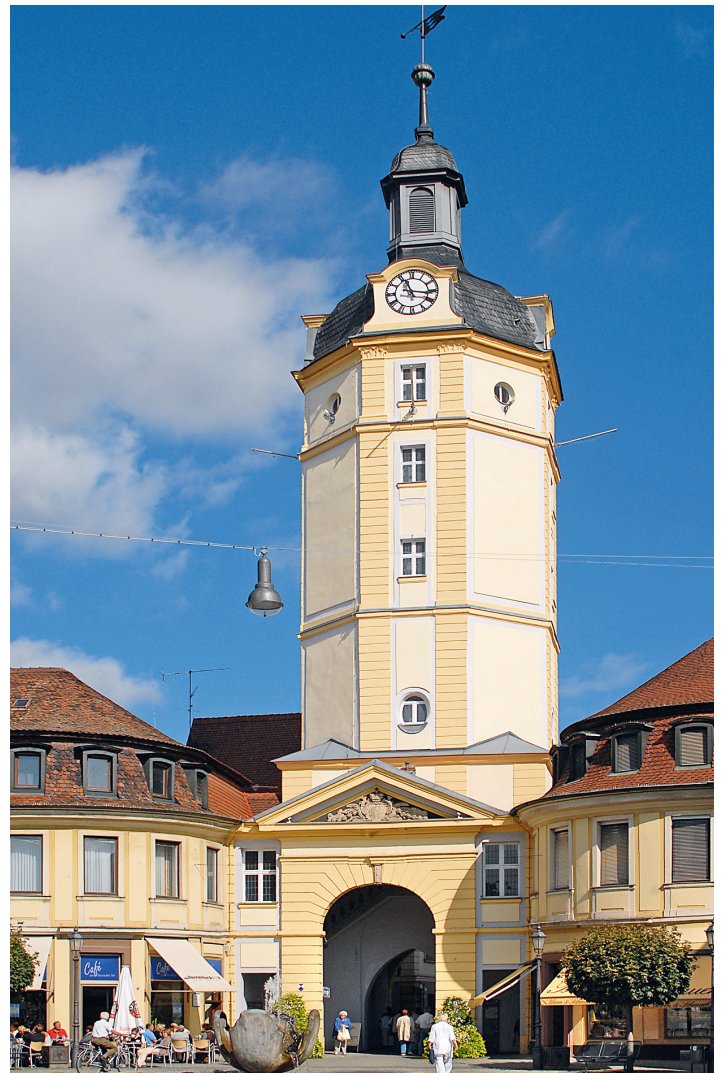
Eingang zur Fußgängerzone durch das Herrieder Tor

Bericht und Bilder: Stadt Ansbach, Amt für Kultur und Touristik