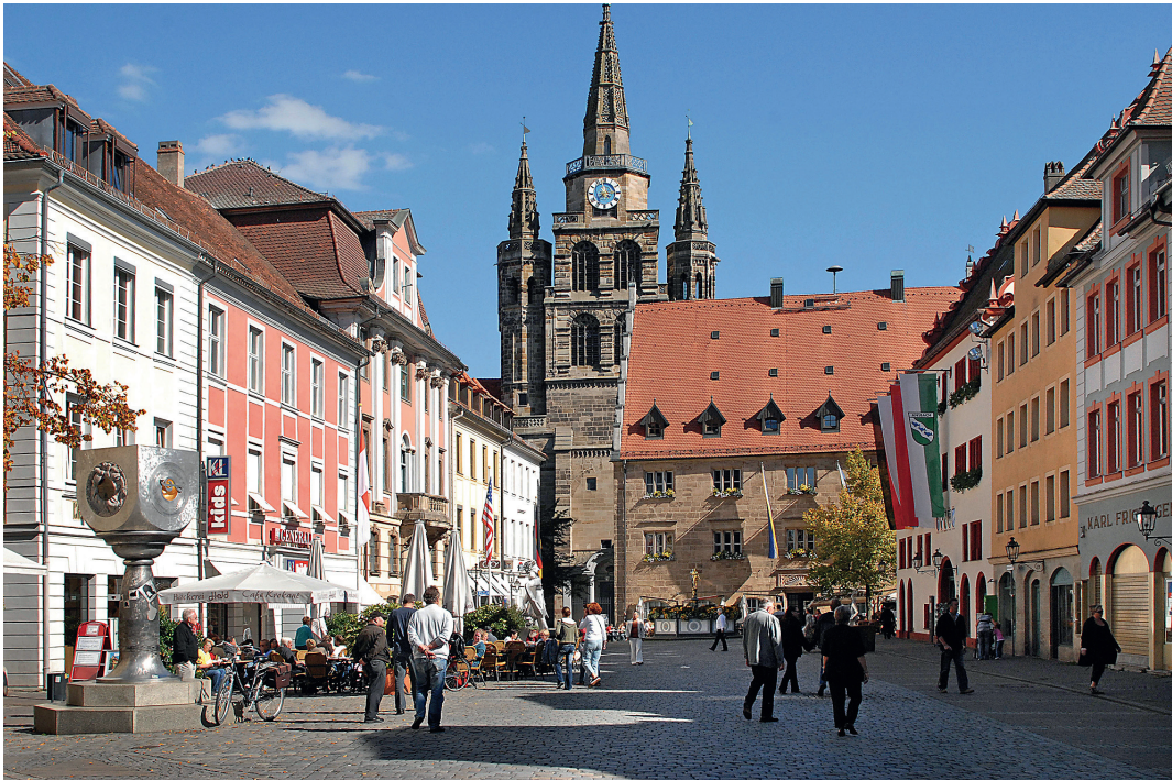
Ein Teil der Ansbacher Fußgängerzone mit der Kirche St. Gumbertus

Festspiele werden höfische Eleganz, Galanterie und fürstliche Noblesse zu neuem Leben erweckt.