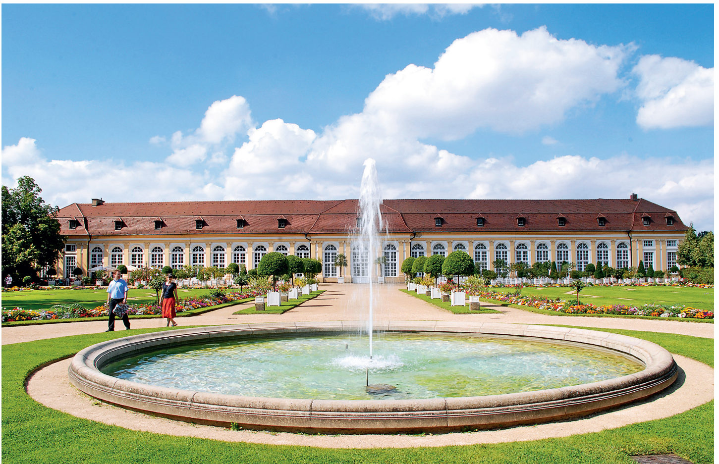
Die Ansbacher Orangerie im Hofgarten

Ansbachs Veranstaltungskalender ist einmalig in seiner Art und Vielfalt. Herausragende Ereignisse im festlichen Geschehen der Stadt sind die jährlich Anfang Juli stattfindenden Rokoko-Festspiele und die internationale "Bachwoche Ansbach" sowie die "Internationalen Ansbacher Gitarrenkonzerte". Während der mehrtägigen Rokoko-