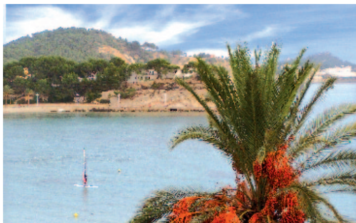
Hier wollen wir den Sommer verlängern.

Im Oktober möchten wir zusammen mit Ihnen die Vulkaninsel Lanzarote erkunden. In guten Mittelklassehotels zum Relaxen am Strand und einem interessanten Ausflugsprogramm werden wir eine "Sommerverlängerungswoche" anbieten, die es zu diesem Preis nirgendwo geben wird. Es wäre schön, wenn Mitglieder, die Gefallen an einer