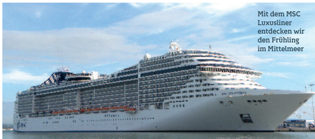
Mit dem MSC Luxusliner entdecken wir den Frühling im Mittelmeer

derartigen Gruppenreise haben, bis Ende August 2014 mit einer kurzen und unverbindlichen e-Mail an Clubverwaltung@navc.de ihr Interesse bekunden würden. So können wir feststellen, ob es sich lohnt, die Angebote im Detail auszuarbeiten.