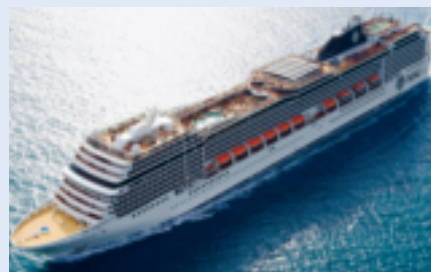
Die MSC Magnifica

Weitere von der Clubverwaltung betreute Gruppenreisen sind bis Ende 2016 nicht mehr in Planung, weil man sich voll auf die Kreuzfahrt konzentrieren möchte, um wieder ein echtes Highlight anbieten zu können. Wenn sich allerdings aus den Reihen unserer Mitglieder und Ortsclubs Grüppchen zusammenschließen wollen, um gemeinsam die Fremde zu erkunden, dann ist die NAVC Clubverwaltung genau der richtige Ansprechpartner für vergünstigte Gruppentarife. Einfach mal nachfragen, weil Info kost nix, aber viel Geld spart!