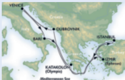
Unsere Route im östlichen Mittelmeer