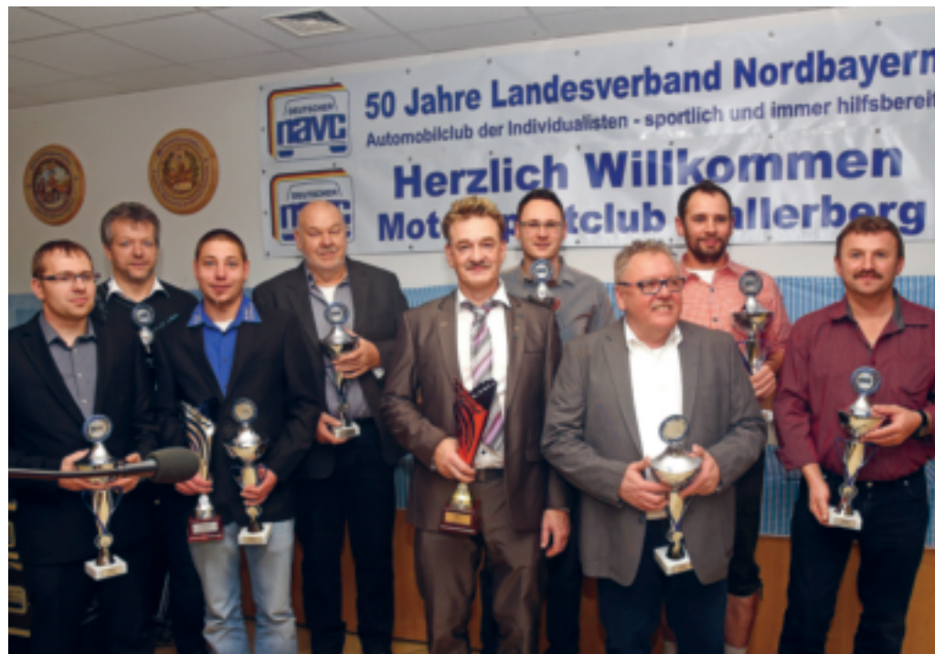
Meister im NAVC Landesverband Nordbayern