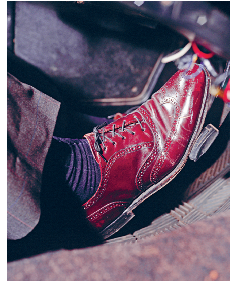
Ein sanftes Klopfen genügt, um die Grenze zwischen Pedalstreicheln und Bleifuß anzuzeigen.

Weitere Funktionen entstehen durch die Vernetzung mit Onlinedaten: In Verbindung mit dem Navigationssystem