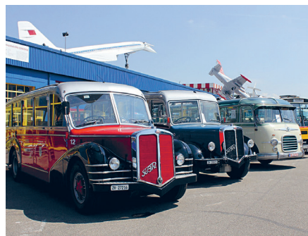
Die Oldies warten auf interessierte Besucher

geboren. Dieses Treffen soll der Öffentlichkeit die Geschichte des Omnibusbaus näherbringen sowie den Besitzern und Freunden historischer Omnibusse eine Plattform zum Kennenlernen, zum Gedankenaustausch und zum geselligen Beisammensein bieten; das Reisen der guten alten Zeit in Erinnerung halten - wie es war, mit einem bunten Haubenbus die Alpen gen Süden zu überqueren!