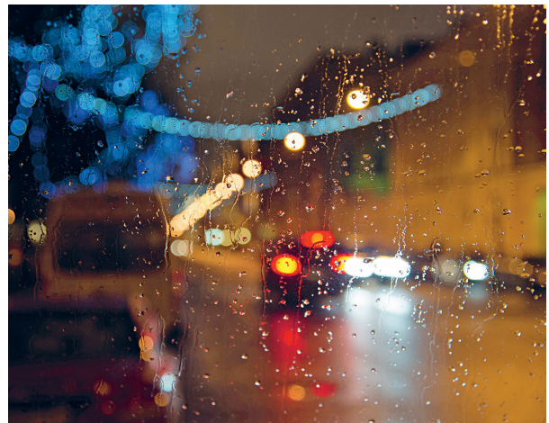
Bei widrigen Witterungsverhältnissen ist das Unfallrisiko auch deshalb erhöht, weil Verkehrsteilnehmer ihre Sehkraft oftmals völlig falsch einschätzen.

verliert offenbar das Gefühl für seine Sehstärke. Die Empfehlung von Experten ist daher eindeutig: Jeder Autofahrer sollte seine Augen regelmäßig kontrollieren lassen. Schnell, zuverlässig und ohne Terminvereinbarung geht das meist beim Optiker. Nur so kann die Sicherheit erhöht werden - für die Fahrer selbst und für alle anderen Verkehrsteilnehmer.