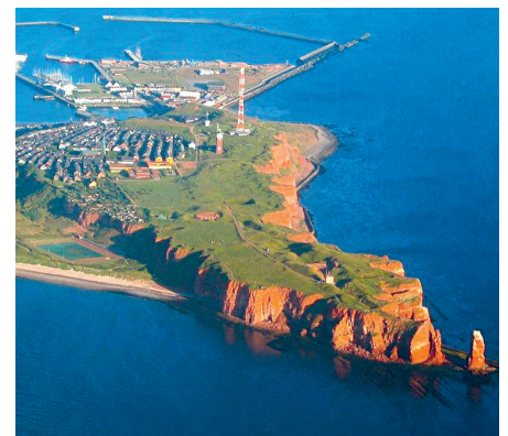
Die „Alte Liebe“ in Cuxhaven, von hier geht's nach Helgoland