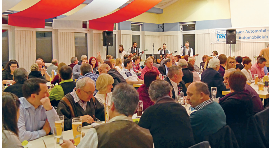
Es war richtig voll, beim MSC Jura