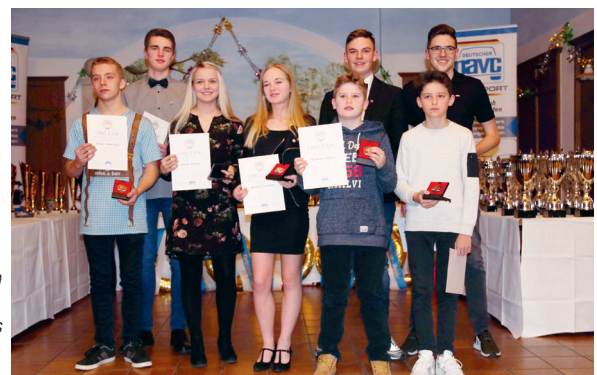
→ Die neugekrönten Träger der NAVC-Sportabzeichen aus dem Landesverband Nordbayern.