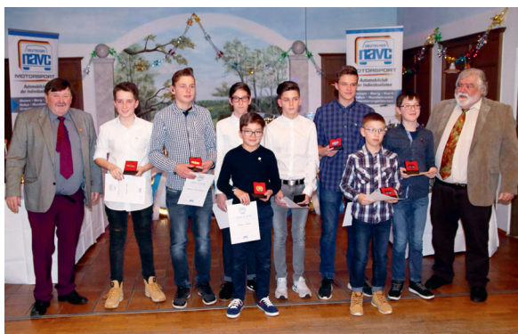
← Stolz präsentieren auch die Südbayern ihre neuen NAVC-Sportabzeichen