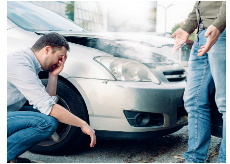
Auch nach kleinen Karambolagen müssen sich Schädiger und Geschädigter mit der oft mühsamen Unfallabwicklung befassen.