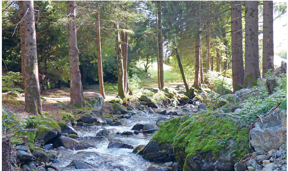
Wasser ist ein Lebenselixier – das bringt eine geführte Wanderung entlang des Schalderer Baches näher.

Vom 9. Mai bis 25. Mai 2019 findet in Brixen die dritte Auflage des Water Light