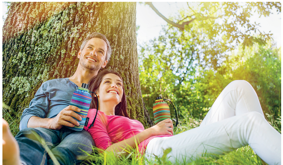
Mehrweg-Trinkflaschen aus Glas sind eine gute Alternative zu Plastikbehältern.

Beim Einkaufen auf Plastiktüten- und -flaschen verzichten und für den kleinen Durst unterwegs eine Mehrwegflasche aus Glas verwenden: Jeder kann seinen Plastikverbrauch im Alltag senken. Doch auch in der Drogerie heißt es „Augen auf“: Denn in Flüssigseife, Peelingcreme, Duschgel und anderen Pflegeprodukten kann Mikroplastik stecken, verborgen hinter Bezeichnungen wie Polyamide (PA), Polypropylen (PP) oder Polyethylen (PE). Daher sollten Verbraucher bei den Inhaltsstoffen genau hinschauen oder zu zertifizierter Naturkosmetik greifen. Kläranlagen sind nicht in der Lage, Kleinstpartikel vollständig aus dem Wasser zu filtern. Laut Angaben der Europäischen Chemikalienagentur gelangen jedes Jahr bis zu 60.000 Tonnen Mikroplastik in die Umwelt.