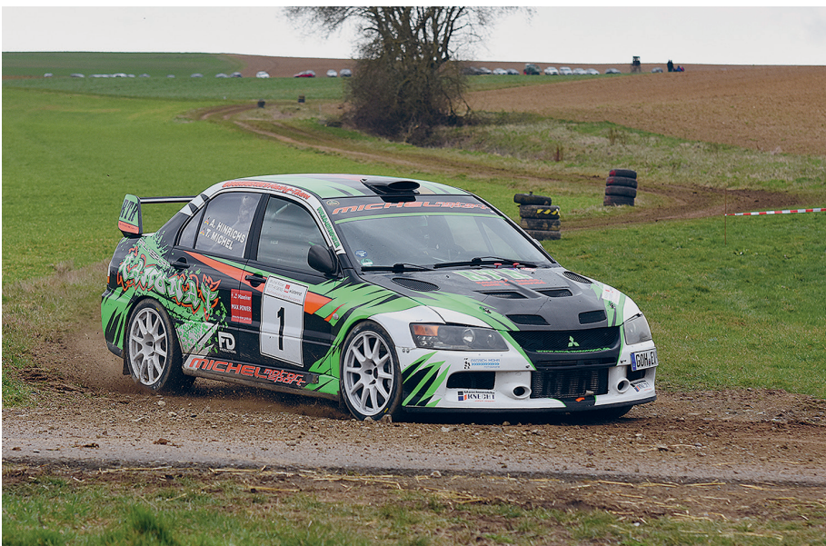
Michel/Hinrichs gewannen die Gruppe 3, mußten sich aber mit Platz 2 im Gesamtklassement zufriedengeben.