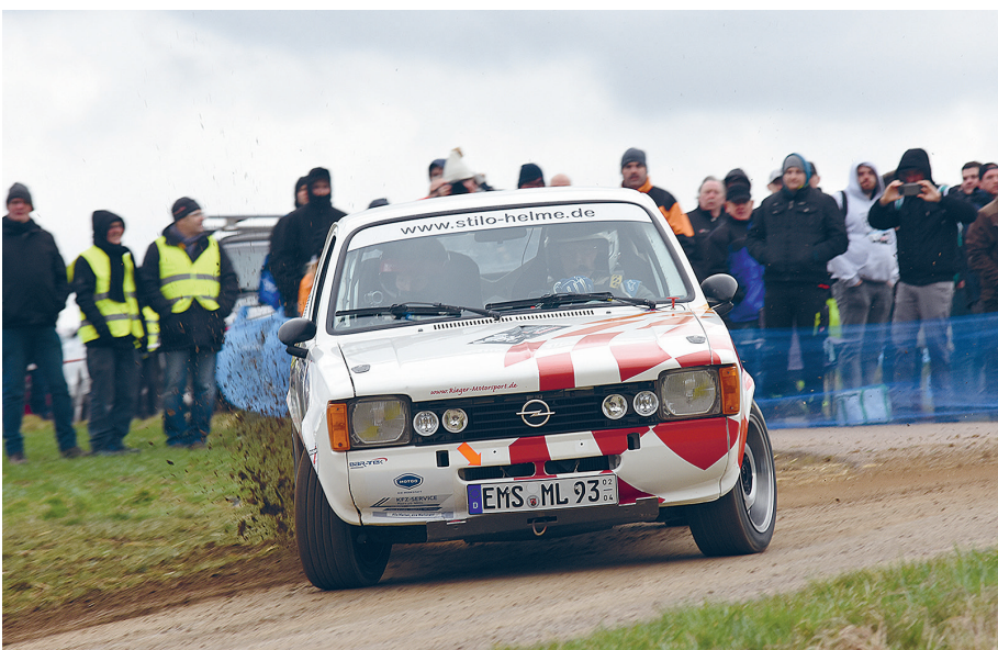
Die „Zweiradler“ hatten einen starken Auftritt, bei der 30. Rallye Zorn.