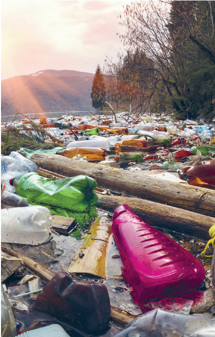
Statistisch gesehen produziert jeder von uns laut Umweltbundesamt (UBA) rund 220 Kilo Verpackungsmüll.

Coffee-to-go im Einwegbecher, in Plastikfolie verpacktes Obst, Essen vom Lieferdienst: Plastik ist in unserem Leben allgegenwärtig. 2017 wurden 4,4 Millionen Tonnen Kunststoffverpackungen produziert - fast 100.000 Tonnen mehr als im Vorjahr. Und nur knapp 50 Prozent des Plastikmülls wurden laut Umweltbundesamt dem Recycling zugeführt. Zwar soll mit dem neuen Verpackungsgesetz, das am 1. Januar 2019 in Kraft trat, die Wiederverwertung von Kunststoffverpackungen weiter gesteigert werden, doch besser ist es auf alle Fälle, grundsätzlich weniger Müll zu produzieren. Denn Kunststoffe machen 85 Prozent der Meeresabfälle aus. Sie belasteten die Ökosysteme und gelangen über die Nahrungskette auch zum Menschen. Jeder Einzelne unter uns kann seinen Beitrag leisten, den Plastikverbrauch zu senken.