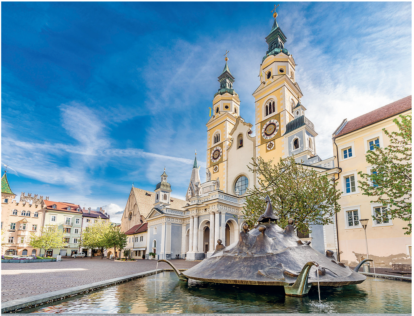
Kunstobjekt auf dem Domplatz: Der Brunnen symbolisiert den Kreislauf des Lebens eines Menschen von der Geburt bis zum Tod.

Mit einer über tausendjährigen Geschichte ist Brixen seit jeher das kulturell-geistige Zentrum Südtirols. Am Zu-