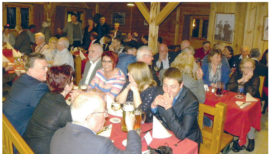
Die Stimmung war gut, in der Hütte des Räucherhansl

Um so erfreuter lud der Präsident dann seine Gäste zum Kongressabend in die „Hütte“ des Räucherhansl, wo am Abend zwei bayerische Vollblutmusiker für Unterhaltung und Tanz sorgten. Schmäckerl aus heimischen Gefilden stärkten Kondition und Ausdauer und so war es nicht verwunderlich, daß der neue Tag schon begonnen hatte, als die letzten NAVCler den Weg von der Kongresshütte ins Räucherhansl Hotelzimmer antraten.