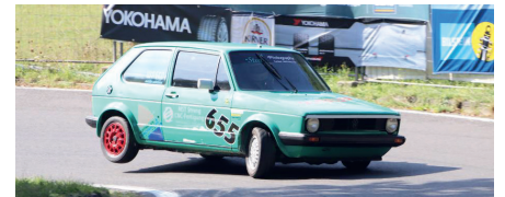
Florian Hübel aus der Klasse 4 der Serientourenwagen

Abschließend gratulieren wir alle Deutschen Amateur Bergmeistern 2019, dem