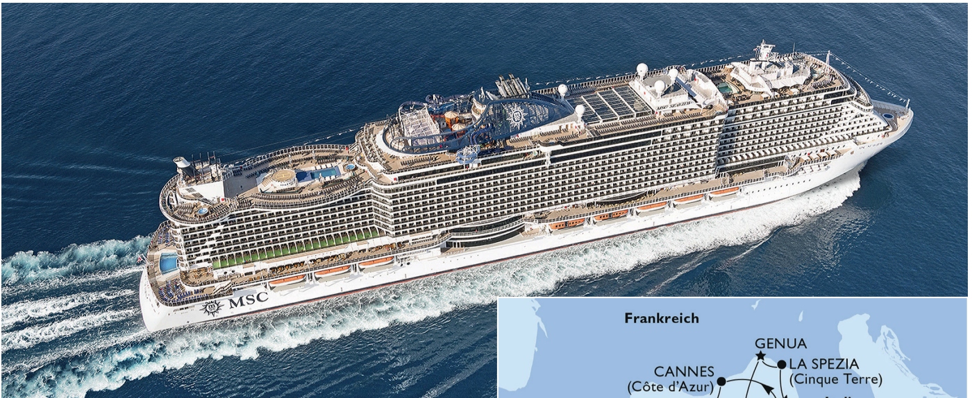
Die MSC Seaview, stolz, elegant und von einmaliger Konzeption

Die Anreise per Fernreisebus mit einer Zwischenübernachtung im Raum Verona bei der Hinfahrt ist auf Wunsch aus fast ganz Deutschland zubuchbar.