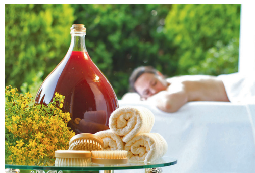
Johanniskrautöl tut dem Menschen gut. (nur eventuell)

Der aromatische Lavendel wird geschätzt für seine heilungsfördernde Wirkung: Man schreibt ihm entzündungshemmende und antibakterielle Eigenschaften zu. Sein sanfter Duft bewirkt in vielen Fällen innere Ruhe. So kann er ebenfalls beim Abschalten helfen. Das macht Lavendel zu einem beliebten Inhaltsstoff für entspannende Massageöle, Körperpflegeöle oder Blütenwasservarianten. Wer mit leichten Hautproblemen zu kämpfen hat, greift gern zu beruhigender Lavendelcreme. Sie pflegt sanft die zu Unreinheiten und Rötungen neigende Haut.