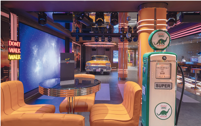
Der „Garagenclub“, die Bar für Automobilisten

Unser erster Anlaufhafen ist La Spezia, wo sich ein Ausflug nach Pisa anbietet. Tag drei gehört Rom, für alle die noch nie dort waren – der Rest unserer Gäste wir wohl das Schiff und seine Annehmlichkeiten genießen. Weiter geht es nach Cannes, wo die Perlen der Cote d'Azur und das Fürstentum Monaco auf uns warten. Dann kommt Mallorca mit seiner Hauptstadt Palma. Neben der herrlichen Altstadt ist die Fahrt mit dem „Orangenexpress, dem roten Blitz“ nach Sóller eine Empfeh-