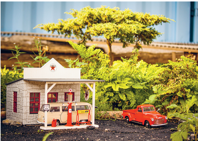
Detailgetreu gestaltete Landschaften zeichnen die verschiedenen Themenbereiche der Modellbauwelten in Bispingen aus.

Ab dem 1. Juli öffnet die größte Modellbauanlage der Welt im Berg & Tal Abenteuerresort in der Nordheide ihre Pforten. In der 12.000-Quadratmeter-Anlage schlängeln sich unzählige Züge auf über 20 Kilometer langen Schienen, mittendrin tauchen die Besucher in mehr als 50 detailgetreue Themenwelten ein. Bayern, die Arktis und das Alte Ägypten, sogar die Welt von Star Wars laden zum Staunen, Entdecken und Erleben ein. Details sind besonders gut zu erkennen, denn alles ist hier erheblich größer als sonst im Modellbau üblich. Darüber hinaus gibt es noch weitere neue Attraktionen, darunter eine Sammlung legendärer Oldtimer.