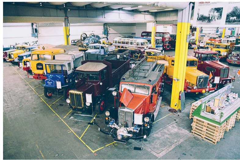
Ein ganzes Schaudepot widmet sich der Präsentation von Bussen und Lkw.

Über 400 Exponate und rund 90 Aktivstationen machen die Ausstellung im ehemaligen Kornspeicher zu einem interaktiven und multimedialen Erlebnis, das nicht nur Technikbegeisterte in seinen Bann zieht. Besucher erkunden, wie Fahrzeuge in den vergangenen 200 Jahren das Leben der Menschen veränderten, werfen aber auch einen Blick in die Zukunft der Mobilität. Wenn der PS.Speicher im Laufe dieses Jahres nach und nach seine vier Depots mit historischen Motorrädern, Kleinwagen, Bussen und Lanz Bulldogs öffnet, beherbergt der Erlebnis- und Ausstellungspark die größte zugängliche Oldtimersammlung Europas.