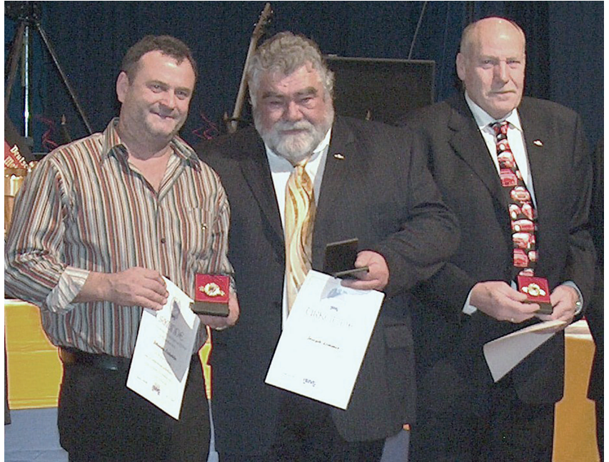
Im Ranking der ewigen Besten liegen „die DREI“ auch heute noch in gleicher Reihenfolge auf den ersten Plätzen.

Zur Geschichte: Im Jahre 2007 stellte man fest, daß bereits eine größere Zahl von NAVC Motorsportlern das damals höchste Sportabzeichen erreicht und die Schwelle von 6.000 Punkten überschritten hatten. Es gab kein weiteres Ziel in der Hierarchie der NAVC Sportabzeichen, das es zu erreichen galt. Dem mußte natürlich Abhilfe geschaffen werden und so wurde die NAVC Motorsportspange in Gold mit Lorbeerkranz und Brillanten für die runde Zahl von 10.000 Punkte kreiert. Diese hochwertige Auszeichnung wurde bei der Sportfahrehrung 2007 in Gunzenhausen erstmals verliehen. Aus den Händen von NAVC Ehrenmitglied Kurt