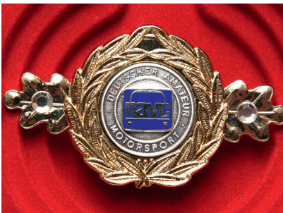
Der Inbegriff der Begierde: Die Motorsportspange in Gold mit Lorbeerkranz und Brillanten, die Anstecknadel aus purem Gold mit echten Diamanten

Neben dem ideellen Wert, den ein NAVC Sportabzeichen für eine manchmal lebenslange motorsportliche Aktivität widerspiegelt, ist auch der materielle Wert der NAVC Sportabzeichen erwähnenswert. Die Abzeichen werden in der Münzmanufaktur Fritz Reu in Handarbeit exklusiv für den Deutschen NAVC hergestellt. Die einfachsten Ausführungen stellen zusammen mit der zugehörigen Urkunde einen Wert von ca. € 35,00 dar. Die Anstecknadel des Abzeichens für 10.000 Punkte ist aus massivem Gold gefertigt und mit echten Diamantsplittern besetzt. Über den finanziellen Wert dieser Kostbarkeit schweigt man sich aus, schon wegen des schwankenden Goldpreises.