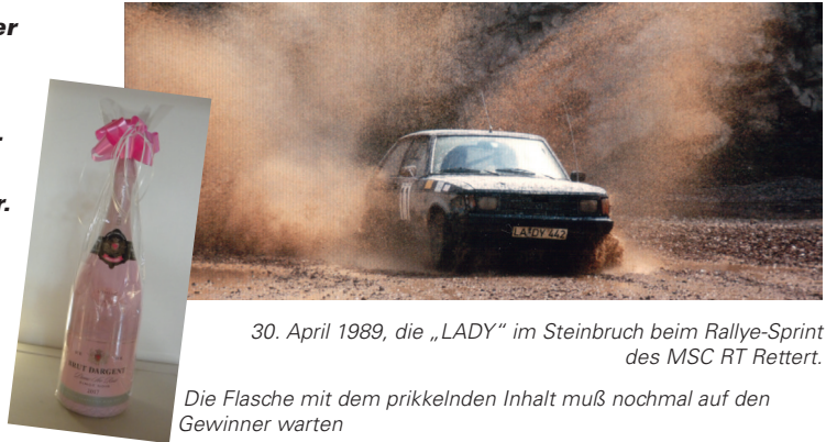
30. April 1989, die „LADY“ im Steinbruch beim Rallye-Sprint des MSC RT Rettert.

Das Quizzz im Oktober war sehr schwer da kommt der Redakteur daher will wissen, wo und wann denn nur die LADY durch das Schlammloch fuhr. Startnummer 11, kaputter Blinker, eine Felswand sieht man auch dahinter. Wie soll man wissen wann das war? Selbst Mister Google ist's nicht klar. Ein Rallye-Sprint war es bestimmt wer das nun weiß, ja der gewinnt. Daß der sich freut, das ist gewiß wir freuen uns auf ein neues Quizzz.