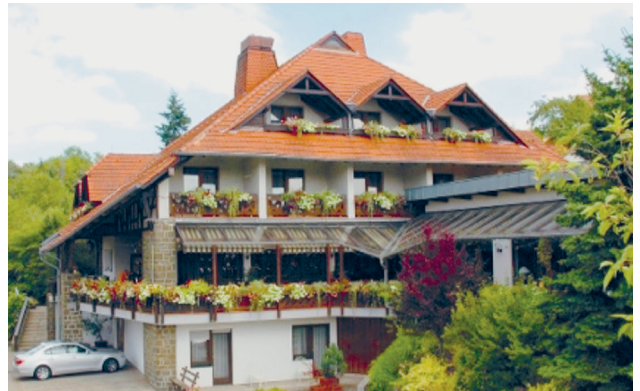
Das Hotel Reweschnier, unser Tagungshotel für den NAVC Kongreß 2021.

Tja, so schaut's aus, für die nächsten sechs Monate. Und weil wir unseren NAVC auch in Zukunft als Alternative mit den besseren Leistungen in der Landschaft der Deutschen Automobilclubs anbieten möchten, müssen wir ihn, also unseren NAVC, ganz einfach bekannter machen. Sprechen Sie Ihre Freunde und Bekannten doch einfach mal an! Der Deutsche NAVC bietet viel mehr als der kleine Beitrag kostet. Nutzen Sie das Beitrittsformular in diesen Clubnachrichten und kassieren Sie so ganz nebenbei die fette Werbeprämie. Infos dazu wie immer in der NAVC Clubverwaltung, Tel. 08744-8678.