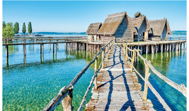
Die Pfahlbauten in Unteruhldingen, Teil des Unesco-Weltkulturerbes, laden zu spannenden Zeitreisen in die Steinzeit ein.

um bei den Pfahlbauten Unteruhldingen, ein Rundgang auf Burg Meersburg und über die Mittelalterbaustelle „Campus Galli“ sowie eine Erkundungstour durchs Zeppelin Museum in Friedrichshafen.