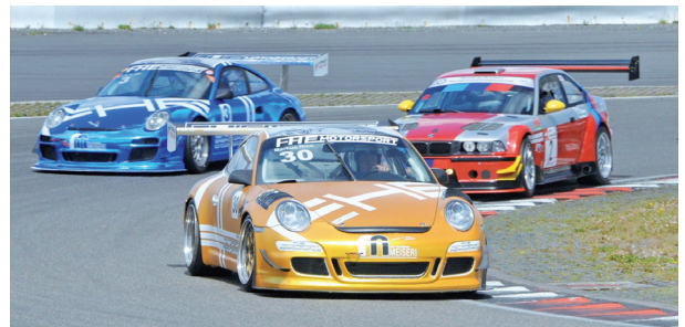
Die wohl stärksten Fahrzeuge im Feld, im Kampf um die Punkte zur RSM 2021: Die Porsche GT3 der FHE-Group und Walter Forster mit seinem BMW.