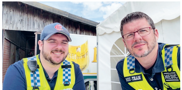
Die „Macher“ bei der RRU

Haben wir dein Interesse geweckt und du möchtest Mitglied der großen NAVC Familie werden, dann melde Dich doch direkt bei uns (01773024219) oder beim Deutschen NAVC (08744-8678).