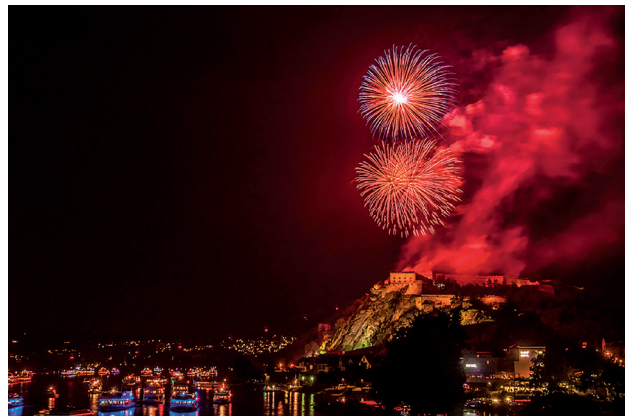
Der Rhein in Flammen – und A-Rosa ist mittendrin!

Die Reiseabteilung in der NAVC Clubverwaltung ist Partner von A-Rosa. Somit können unsere Mitglieder die Top-Leistungen des Rostocker Flußkreuzfahrtspezialisten zu äußerst günstigen Preisen buchen und in Anspruch nehmen. Ein Anruf in Gerzen lohnt allemal, weil: Info kost nix, aber viel Geld spart!