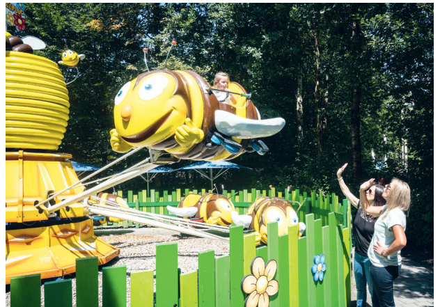
Das Ravensburger Spieleland wurde zum vierten Mal in Folge als familienfreundlichster Themenpark Deutschlands gekürt.

Zu den Klassikern unter den Ausflugszielen gehören auch das Ravensburger Spieleland, das zum vierten Mal in Folge als familienfreundlichster Themenpark Deutschlands gekürt wurde, und der Affenberg Salem mit seinen 200 frei lebenden tierischen Bewohnern.