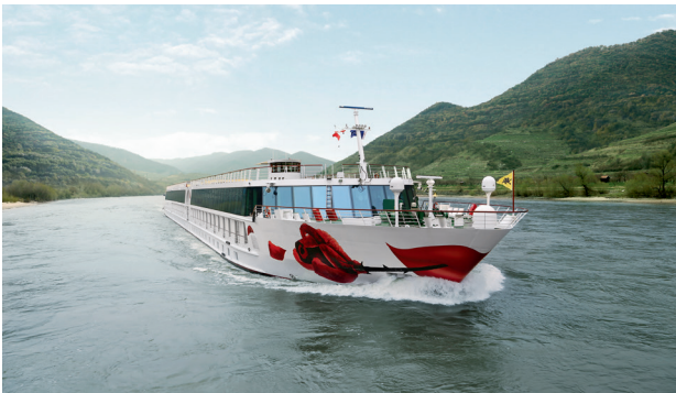
Auf den großen Flüssen unterwegs: Die Schiffe von A-Rosa

(djd). Rhein, Main, Donau, oder ganz exotisch, der Douro in Portugal? Vielleicht darf es auch ein wenig Frankreich sein, auf Rhone und Seine? Kaum eine andere Urlaubsform bietet so eine ausgewogene Mischung aus Abwechslung, Entschleunigung und Sicherheit wie eine Flusskreuzfahrt. Etablierte Anbieter wie A-Rosa Kreuzfahrten verfügen über erprobte Hygiene-Standards, die der aktuellen Situation rund um Corona angepasst wurden.