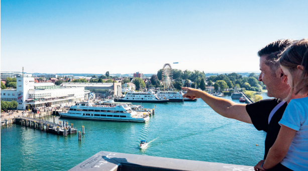
Schiffsausflüge, Museumstouren oder andere Vergnügungen – am Bodensee wird es garantiert nicht langweilig.

(djd). Wo Berge, Wasser und eine entspannte Lebensart aufeinandertreffen, lässt sich Familienurlaub abwechslungsreich gestalten. So ist der Bodensee mit seiner reizvollen Landschaft und seinem fast schon mediterranen Klima für Kinder ein großer Abenteuerspielplatz. Eltern wiederum stoßen hier auf einen idealen Ort zum Aktivsein und Erholen. Hautnahe Erfrischung finden kleine und große Wasserratten zum Beispiel in den zahlreichen familienfreundlichen Strandbädern. Mit Kanus, Tretbooten, Stand-Up-Paddling-Boards (SUP) oder Surfbrettern, die man vielerorts ausleihen kann, lässt sich der Erkundungsradius – actionreich oder ganz gehillt – erweitern.