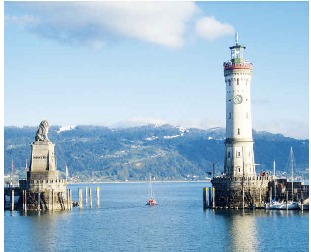
Der Hafen in Lindau, bewacht vom bayerischen Löwen, der da allen sagt: Hier beginnt Bayern!

Neben den vorgenannten, zum Teil nicht ganz so bekannten Ausflugszielen, sind da natürlich noch die ganz Großen unter den Orten, die einfach zu einem Urlaub am Schwäbischen Meer gehören. Sie müssen nicht mehr lange beschrieben werden. Die Stadt Lindau mit ihrer spektakulären Hafeneinfahrt sowie die Insel Mainau, als Paradies für jeden Natur- und Blumenliebhaber, müssen ganz einfach besucht werden. Auch die Festspielstadt Bregenz im benachbarten Österreich darf auf der Liste nicht fehlen und ein Abstecher zum Rheinfall nach Schaffhausen sollte auch eingeplant werden.