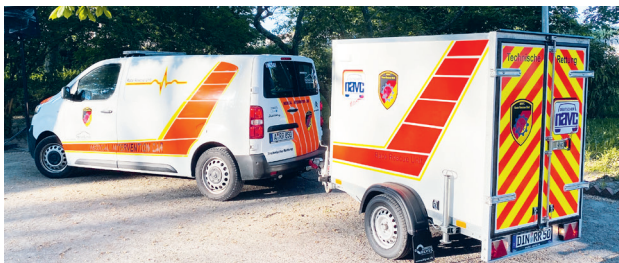
Das neue i-Tüpfelchen im Fuhrpark, der NAVC Transportanhänger

Toll wäre es, wenn du aus dem Bereich Ruhrgebiet / Niederrhein kommen würdest und mobil bist, auch wenn unsere Dienste in ganz Deutschland angeboten werden.