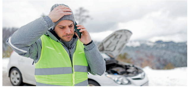
Eine streikende Fahrzeugbatterie gehört zu den häufigsten Pannursachen, gerade in der kalten Jahreszeit.

Defekte Autobatterien sind seit Jahren die Pannursache Nummer eins. Die Fälle häufen sich, sobald die Temperaturen sinken. Der Grund: Batterien, die ohnehin schon altersschwach sind, können die zusätzlichen Belastungen durch eine Frostnacht nicht mehr bewältigen. Um sich ärgerliche Defekte und den damit verbundenen Zeitaufwand zu ersparen, empfiehlt sich daher ein Check in der Fachwerkstatt ein- bis zweimal jährlich. Die Profis können Batterieprobleme frühzeitig erkennen und mit einem Austausch des Energiespenders für pannenfreies Fahren auch in der kalten Jahreszeit sorgen. Zusätzliche Sicherheit für unterwegs geben mobile Ladegeräte.