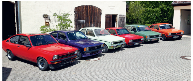
Die Flotte der C-Kadetten unseres Clubfreudes „Hanni“

Nun, wer weiß wie der „Hanni“ richtig heißt? Mit vollem Namen und allen (!) Vornamen? Und wie heißt „sein“ Club? Wer die Antworten kennt und die große Flasche Prosecco gewinnen möchte, der sollte jetzt ganz schnell die richtigen Antworten an Clubverwaltung@navc.de senden! Wer zuerst mailt, der gewinnt auch am ehesten. Ausgenommen von der Teilnahme sind die Mitglieder des Redaktionsteams der NAVC Clubnachrichten sowie alle Mitglieder von Hannis Heimatclub und deren Familienangehörige.