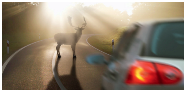
Bei plötzlichen Bremsmanövern kommt es auf die elektronischen Helfer wie ABS und ESP an.

Wechselnde Straßenbedingungen bei Nebel, Nässe, Eis und Schnee stellen in der kalten Jahreszeit Mensch und Technik gleichermaßen auf die Probe. Um mit dem Auto sicher ans Ziel zu gelangen, sollte man die Fahrweise anpassen. Bei rutschigen Bedingungen sind starkes Gasgeben oder ruckartiges Lenken zu vermeiden. Für zusätzliche Sicherheit sorgen Schutzengel wie das elektronische Stabilitätsprogramm ESP. Es umfasst die Funktionen des Antiblockiersystems (ABS) und der Antriebsschlupfregelung (ASR), erkennt aber auch Schleuderbewegungen und wirkt diesen aktiv entgegen. Der Schleuderschutz hat nach Berechnungen der Bosch-Unfallforschung seit seiner Einführung in der EU rund 15.000 Menschen das Leben gerettet und knapp eine halbe Million Unfälle mit Personenschaden verhindert.