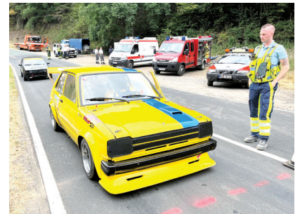
Fast schon ein Oldtimer: Toyota Starlet der Klasse 9 am Start in Klotten