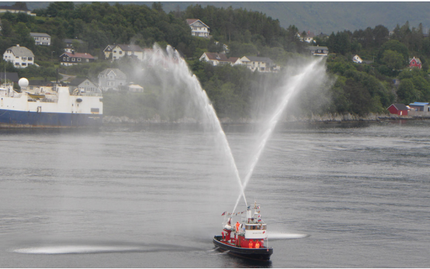
Fontänen zur Verabschiedung

Gegen Abend brach die Euribia zu unserem nächsten Höhepunkt auf. Flam, am Ende des Aurlandsfjords gelegen, ist die Endstation der berühmten Flambahn, die hinauf nach Myrdal führt. Diese Eisenbahnstrecke ist nach Meinung vieler Experten noch spektakulärer als die bekannten schweizer Alpenbahnen. Natürlich hat unsere Gruppe eine Fahrt mit der Flambahn unternommen und wieder spektakuläre Eindrücke gesammelt.