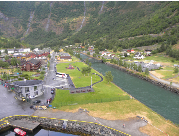
Flam grüßt am Ende des Aurlandsfjordes

Gegen Abend brach die Euribia zu unserem nächsten Höhepunkt auf. Flam, am Ende des Aurlandsfjords gelegen, ist die Endstation der berühmten Flambahn, die hinauf nach Myrdal führt. Diese Eisenbahnstrecke ist nach Meinung vieler Experten noch spektakulärer als die bekannten schweizer Alpenbahnen. Natürlich hat unsere Gruppe eine Fahrt mit der Flambahn unternommen und wieder spektakuläre Eindrücke gesammelt.