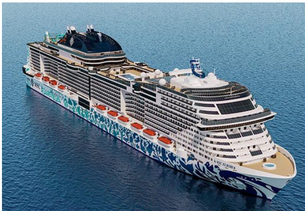
Das neue Flaggschiff der MSC Kreuzfahrtflotte. Die MSC Euribia, das schwimmende Luxushotel für 24 Gäste aus den Reihen des Deutschen NAVC.

Die Wirren um die Corona-Pandemie hatten sich langsam gelegt und so war der Weg frei für die sechste NAVC Gruppen-Kreuzfahrt. Bereits im Oktober 2022 begann man in der NAVC Clubverwaltung mit der Planung einer ganz besonderen Kreuzfahrt in die Fjorde Norwegens. Das neueste und umweltfreundlichste Schiff von MSC wurde ausgewählt, um die strengen Bestimmungen Norwegens erfüllen zu können und die schönsten Fjorde bis an ihr Ende befahren zu können.