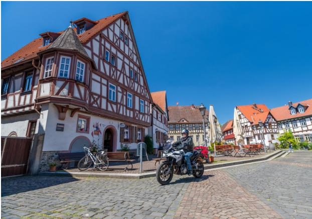
Unterwegs auf der Deutschen Fachwerkstraße: Auch mit dem Motorrad kann man auf den Spuren der Vergangenheit unterwegs sein, wie hier im hessischen Hanau-Steinheim.

(DJD). Auf insgesamt rund 3.900 Kilometern weist die Deutsche Fachwerkstraße mit ihren acht Regionalstrecken den Weg durch mehr als 700 Jahre Fachwerkgeschichte. Sie führt vorbei an prunkvollen Rathäusern und Marktplätzen, stolzen Bürgerhäusern und malerischen Gassen. 121 Fachwerkstädte aus Niedersachsen, Sachsen-Anhalt, Sachsen, Hessen, Rheinland-Pfalz, Thüringen, Bayern und Baden-Württemberg haben sich unter dem Motto „Fachwerk verbindet“ zusammengeschlossen, alle Infos gibt es unter www.deutsche-fachwerkstrasse.de . Auch mit dem Motorrad kann man auf den Spuren der Vergangenheit alte Handwerkskunst und lebendiges traditionelles Brauchtum entdecken. In Kooperation mit einem großen Motorrad-Magazin wurden die schönsten Touren ausgesucht - von der kleinen Rundtour bis zum Reiseerlebnis über mehrere Tage. Zu jeder Fachwerkstadt gibt es zudem mindestens eine Start-/Ziel-Tour, damit sich auch ein längerer Aufenthalt mit Übernachtung lohnt. Hier sind drei Tourenvorschläge aus Nord-, Ost- und Süddeutschland.