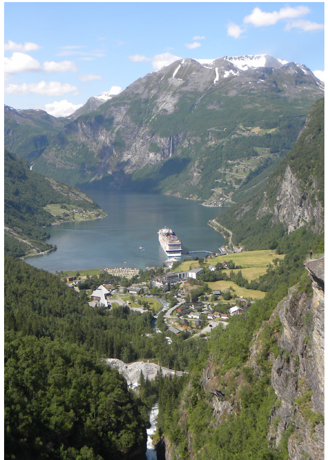
Die MSC Euribia am Ende des Geiranger, eingerahmt von unbeschreiblichen Naturgewalten

Alesund hieß unser nächster Hafen. Die Stadt wurde nach einem verheerenden Feuer im Jahre 1904 komplett neu aufgebaut und hat deshalb einen gänzlich anderen Baustil aufzuweisen. Direkt am Liegeplatz unseres Schiffes inmitten der Stadt startet die Rundfahrt mit der „Bimmelbahn“. Sie fährt auch auf dem Berg Aksla, wo es einen wunderschönen Aussichtspunkt gibt, von dem aus sich ein herrlicher Rundblick über die Stadt und ihre umliegenden Inseln und Fjorde eröffnet.