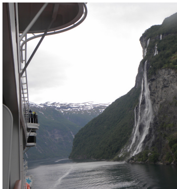
Das war Maßarbeit von Kapitän und Lotse

Gegen 18.00 Uhr brach die Euribia auf in Richtung Hellesylt, zum ersten Höhepunkt unserer Kreuzfahrt, dem Geirangerfjord. Zur Bewältigung der langen Strecke war zunächst ein „Seetag“ angesetzt, bevor wir in den spektakulären Meeresarm einführten.