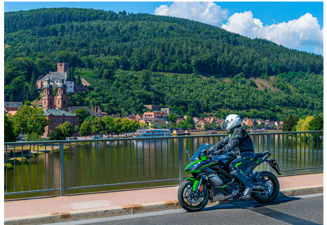
Dieser Biker blickt über den Main auf Miltenberg. Der unterfränkische Ort glänzt mit einer mittelalterlichen Altstadt voller Fachwerkbauten, romantischer Gassen und versteckter Winkel.

Zittauer Gebirge, Elbsandsteingebirge und Sächsische Schweiz sind unter anderem die Ziele dieser Tour. In Tschechien führt die Strecke durch die Böhmisches Schweiz. In den Orten der Oberlausitzer Umgebendehausstraße sollte ein Stopp und ein Rundgang durch die Umgebendehauslandschaft eingeplant werden. Tipp: Auf der tschechischen Seite der Landschaft ist die Bikerhöhle Pekelné Doly ein Besichtigungs-Muss.