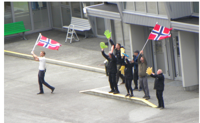
Die Verabschiedung beim Auslaufen war wieder einmal sehr emotional!