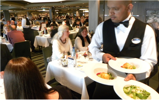
Perfekter Service beim Dinner am Abend war selbstverständlich