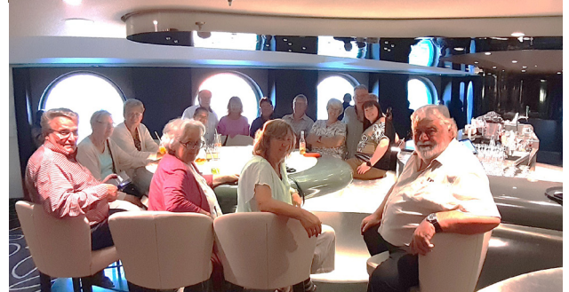
Einer unserer Lieblingsorte war die „Infinity-Bar“ mit ausgesprochen nettem Personal.