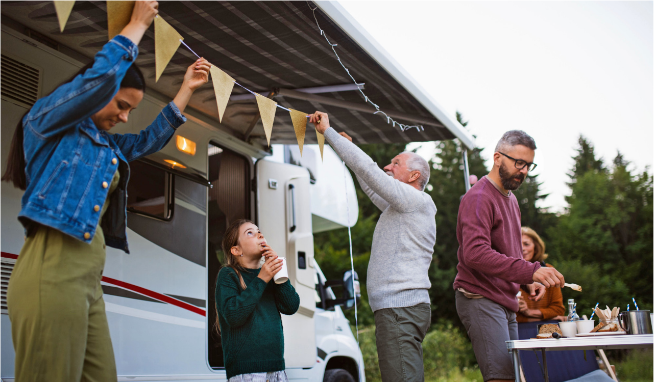
Ob mit Wohnmobil, Caravan oder Zelt: Campingurlaub ist bei den Deutschen beliebt.

(DJD). Sommerzeit ist Campingzeit. Allein in Deutschland gibt es dem Onlineportal Statista zufolge mehr als 2.800 geöffnete Campingplätze. Vor dem Urlaub sollten alle, die mit Wohnmobil oder Caravan starten wollen, ihre Ausrüstung und auch den Versicherungsschutz prüfen. Das spart Stress und unnötige Kosten.