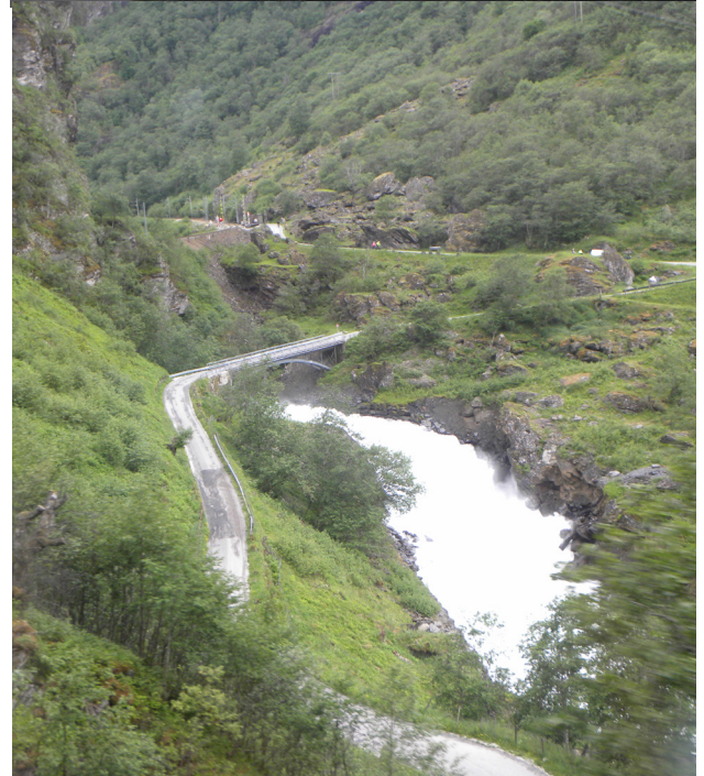
Mit der berühmten Flambahn ging's in die „natur incomparable“ Von Flam ging es dann zurück in Richtung Kiel.