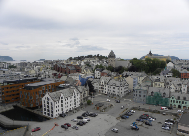
Blick auf Alesund aus luftiger Höhe vom Deck der Euribia