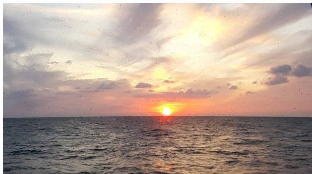
...vom Bullauge unserer Lieblingsbar betrachtet!

Wir hatten nochmal einen ganzen Tag auf See und genossen den Luxus unseres Schiffes. Obwohl wir nicht ganz am Polarkreis waren, erlebten wir Sonnenuntergänge, wie man sie schöner nicht malen könnte. Durch den absolut besten Reiseterrain des Jahres verschwand die Sonne erst gegen 23.30 Uhr am Horizont und hinterließ eine sagenhafte Rotfärbung am Himmel.