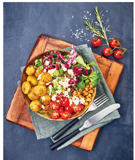
Text und Bild: JL/djd

Zubereitung: Die Rosmarinkartoffeln je nach Geschmack entweder bei mittlerer Hitze circa 15 Minuten in der beschichteten Pfanne erhitzen oder bei 200 °C für 20 Minuten im Ofen backen. In der Zwischenzeit die Ki-chererbsen in ein Sieb schütten und kalt abbrausen. Mit Olivenöl in ei-ner Pfanne erhitzen und anbraten, mit Kurkuma, Kreuzkümmel, Salz und Pfeffer abschmecken. Die Tomaten waschen, trocknen und halbieren. Den Pflücksalat waschen und trocknen. Die Lauchzwiebeln putzen und in dün-ne Ringe schneiden. Den Fetakäse krümelig bröseln. Alle Zutaten für das Dressing gut verquirlen und mit Salz und Pfeffer abschmecken. Vier tiefe Schüsseln mit den warmen Kartoffeln, Kichererbsen, Tomaten, Salat und Frühlingszwiebel bestücken, das Dressing darüber verteilen und mit Käse und Petersilie bestreuen.