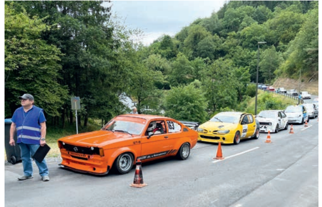
Sie scharren schon mit den Hufen, am Start des Moselbergpreises in Klotten

Der ASC Rheingau veranstaltet am 20. & 21. Juli 2024 den 52. & 53. Moselbergpreis in Klotten an der Mosel. Das Bergrennen ist das Einzige seiner Art im NAVC Bergmeisterschafts Kalender 2024. Die beiden Veranstaltungen am Samstag und Sonntag zählen als 3. & 4. Lauf zur Deutschen Amateur Bergmeisterschaft 2024. Bekannt ist die anspruchsvolle Bergrennstrecke schon lange bei den Motorsportlerinnen & Motorsportlern und eine besondere Herausforderung ist die lange Zielkurve. In dieser haben auch die Zuschauerinnen und Zuschauer die Möglichkeit dem Bergrennsport beim Deutschen NAVC live beizuwohnen. Für die Versorgung mit Essen und Getränken ist gesorgt und unser Streckensprecher informiert alle mit den notwendigen Informationen rund um Teilnehmerinnen und Teilnehmer sowie die Wettbewerbsfahrzeuge.