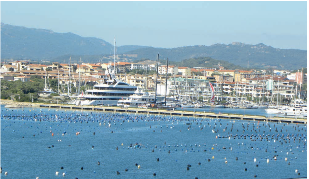
Hier werden Meeresfrüchte geerntet. – Muschelbänke vor der Küste Sardinien.

Olbia, auf der italienischen Insel Sardinien, war dann unser letzter Stop, bevor es zurück nach Genua ging. Hier konnte nochmals bei mediterranem Flair die ganz besondere sardische Lebensart genossen werden.