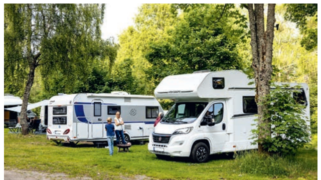
Die kleinen, gemütlichen Camping- und Reisemobilplätze sind von wilder Natur umgeben.

Reisemobilisten, Wohnmobil-Freunde und Camper, die abseits der Massen Urlaub machen wollen, finden genau das in der ostbayerischen Ferienregion Nationalpark Bayerischer Wald. Hier geht es deutlich entspannt zu. Viele der Plätze liegen ruhig am Rande des Nationalparks Bayerischer Wald und sind umgeben von einem Waldmeer. Statt riesiger Areale gibt es kleine, gemütliche Anlagen mit meist wenigen naturnahen Stellplätzen. Tagsüber lädt die abwechslungsreiche Natur zu langen Wanderungen oder Radtouren ein, auch grenzüberschreitende Wege in den tschechischen Nationalpark Šumava gibt es. Wie unter www.ferienregion-nationalpark.de zu lesen ist, wird im Herbst zudem ein spezielles Reisemobil-Treffen mit eventreichem Programm in der Glasstadt Zwiesel veranstaltet.