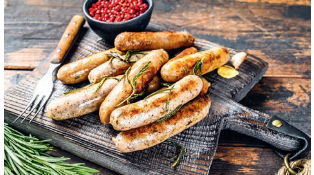
Würstchen sind der Klassiker auf dem Grill - der Naturdarm sorgt für den berühmten Knackeffekt.